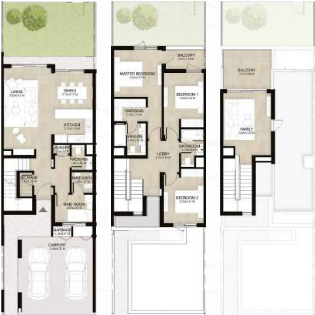
GROUND LEVEL الطابق الأرضي FIRST LEVEL الطابق الأول ROOF LEVEL السطح

3غرف نوم + غرفة عائلية و غرفة خادمة - الوحدة المتوسطة المساحة الكلية: 238.55 متر مربع / 2,568 قدم مربع 3-BEDROOM+FAMILY & MAID - MID UNIT TOTAL AREA: 238.55 SQM / 2,568 SQFT