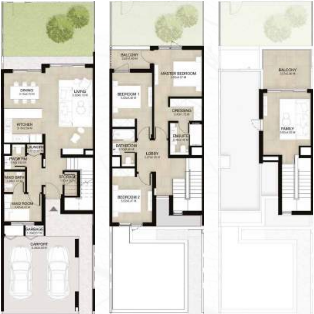
GROUND LEVEL الطابق الأرضي FIRST LEVEL الطابق الأول ROOF LEVEL السطح

3غرف نوم + غرفة عائلية و غرفة خادمة - الوحدة المتوسطة (معكوسة) المساحة الكلية: 238.55 متر مربع / 2,568 قدم مربع 3-BEDROOM+FAMILY & MAID - MID UNIT (MIRRORED) TOTAL AREA: 238.55 SQM / 2,568 SQFT