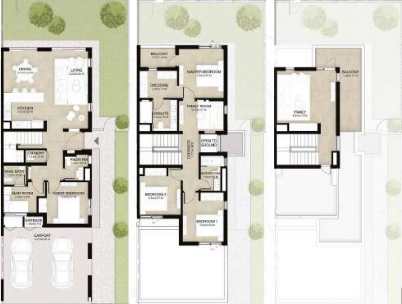
GROUND LEVEL الطابق الأرضي FIRST LEVEL الطابق الأول ROOF LEVEL السطح

4 غرف نوم + غرفة عائلية و غرفة خادمة - الوحدة النهائية (معكوسة)