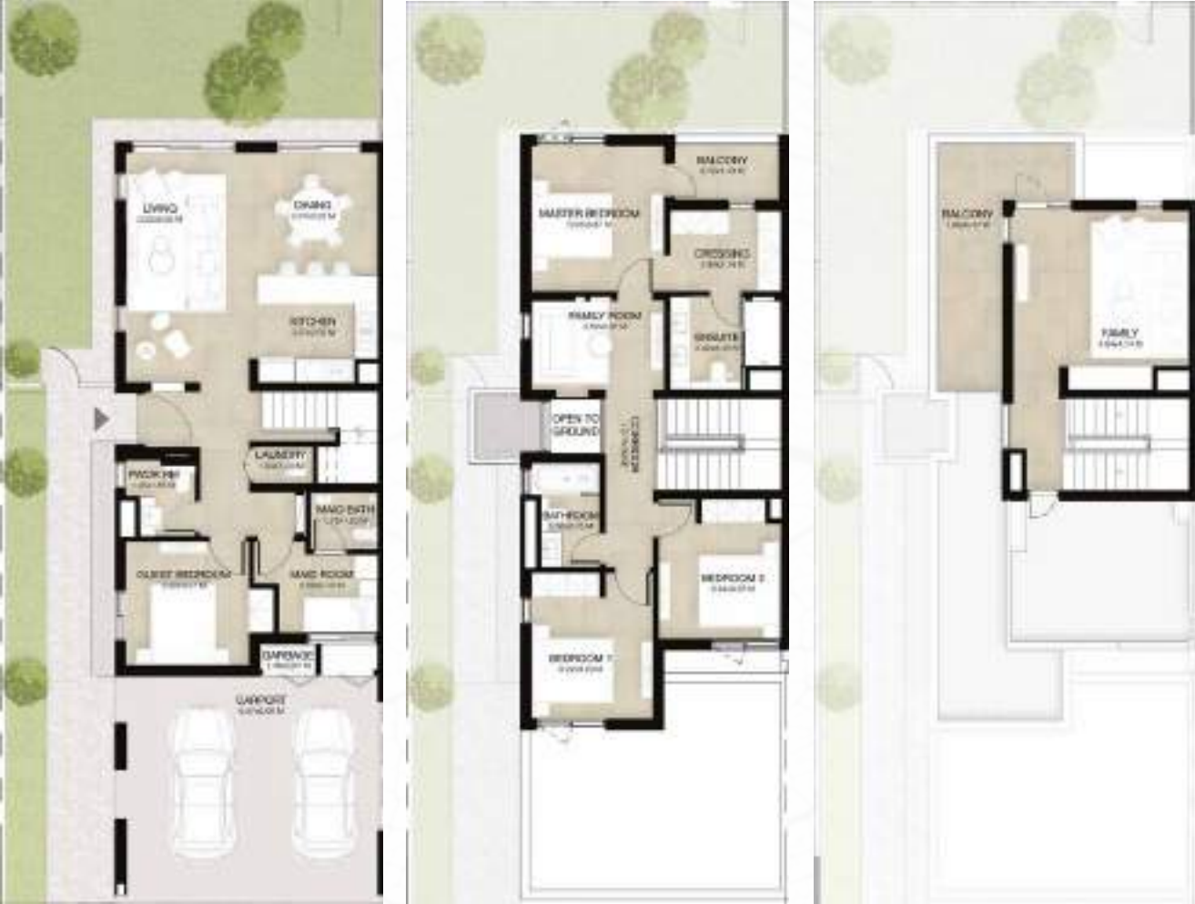
GROUND LEVEL الطابق الأرضي FIRST LEVEL الطابق الأول ROOF LEVEL السطح

4 غرف نوم + غرفة عائلية و غرفة خادمة - الوحدة النهائية